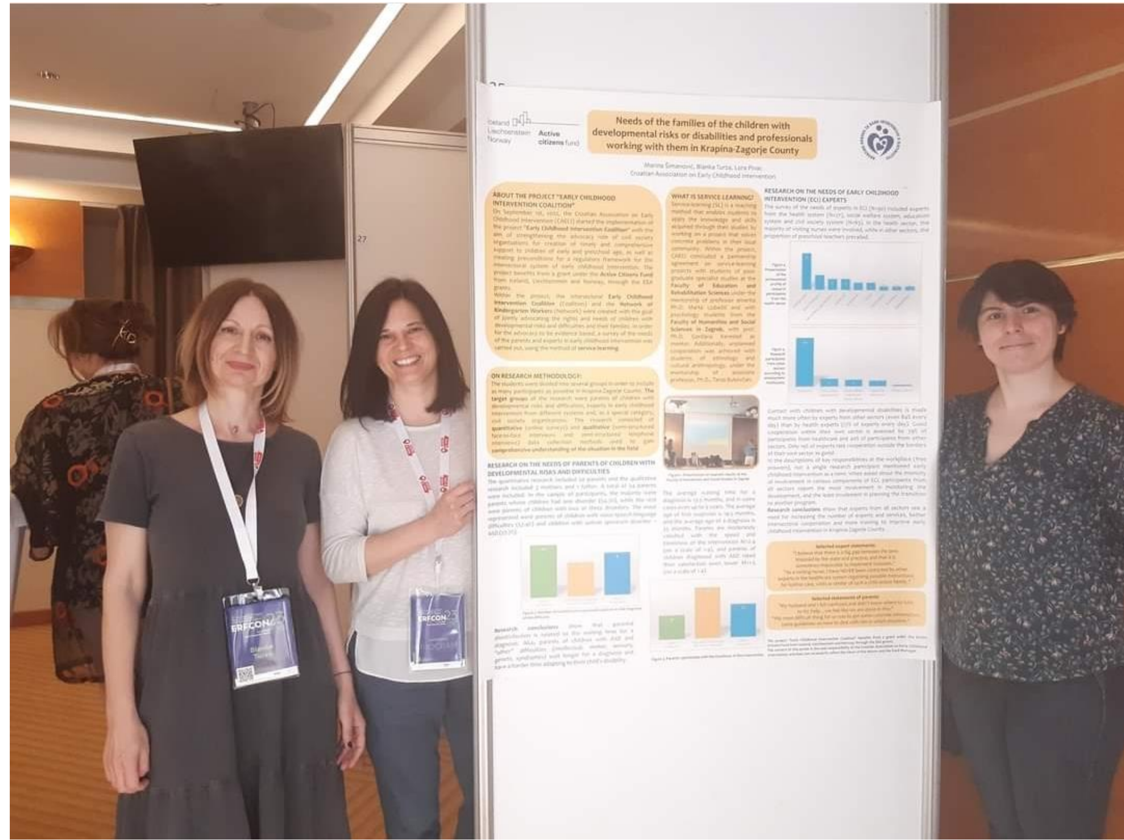
Slika 1. Predstavljanje rezultata istraživanja potreba roditelja i stručnjaka na 10. međunarodnom znanstvenom skupu ERFCON2023

HURID je u sklopu 10. međunarodnog znanstvenog skupa ERFCON2023 predstavio rezultate istraživanja potreba roditelja djece s razvojnim rizicima i teškoćama, potreba stručnjaka raznih profila i potreba za osnaživanjem organizacija civilnog društva u Krapinsko-zagorskoj županiji.