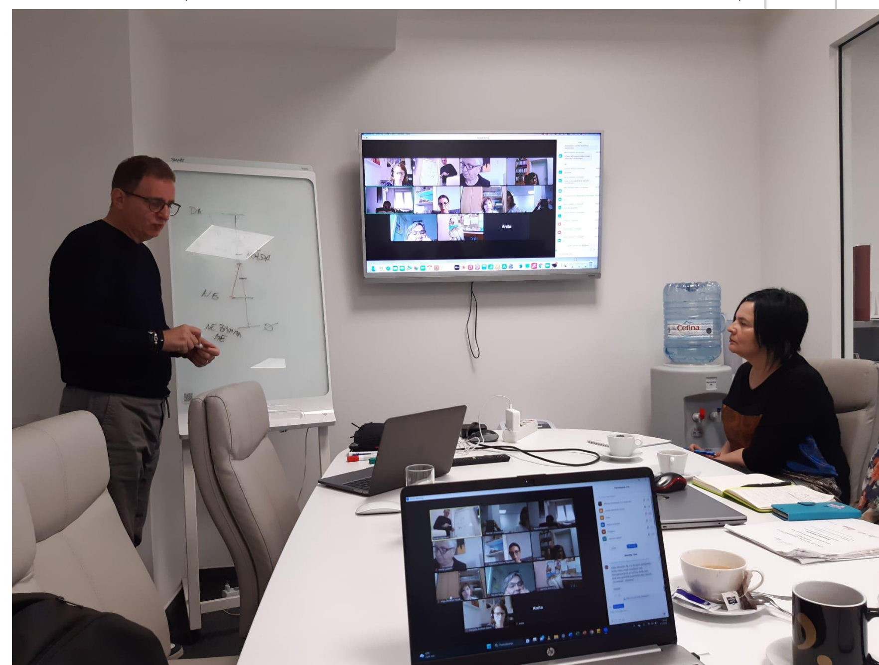
Slika 2. Edukacijska radionica „Osnaživanje strukture i ljudskih resursa OCD-a“ (održana hibridno – uživo i online)

Tijekom svibnja, radne skupine Koalicije za ranu intervenciju u djetinjstvu i Mreže djelatnika dječjih vrtića radile su na izradi prijedloga zagovaračkih preporuka za izgradnju sustava rane intervencije u djetinjstvu u Krapinsko-zagorskoj županiji. U izradi preporuka uzeti su u obzir zaključci istraživanja potreba roditelja i stručnjaka, tematskog skupa, okruglog stola, panel-rasprava i sastanaka. Također, usvojen je zaključak da je izgradnja sustava rane intervencije u djetinjstvu složen proces za koji je potrebno vrijeme i planirana provedba kroz nekoliko faza. Pri tome je nužno krenuti od trenutno dostupnih resursa u lokalnim zajednicama (usluga i stručnjaka), jer čekanje na idealne okolnosti znači dodatno gubljenje vremena i povećani rizik za one kojima je rana intervencija potrebna. Usluge trebaju biti dostupne i besplatne za krajnje korisnike te pružene od strane tima kvalificiranih stručnjaka. Na sastanku radnih skupina Koalicije i Mreže održanom 22. svibnja, članovi su se složili da sadržaj preporuka ne može obuhvatiti sve potrebne promjene, već se treba fokusirati na uspostavu jedinstvenog mjesta pristupa uslugama kao prvog koraka u uspostavi sustava rane intervencije u djetinjstvu.